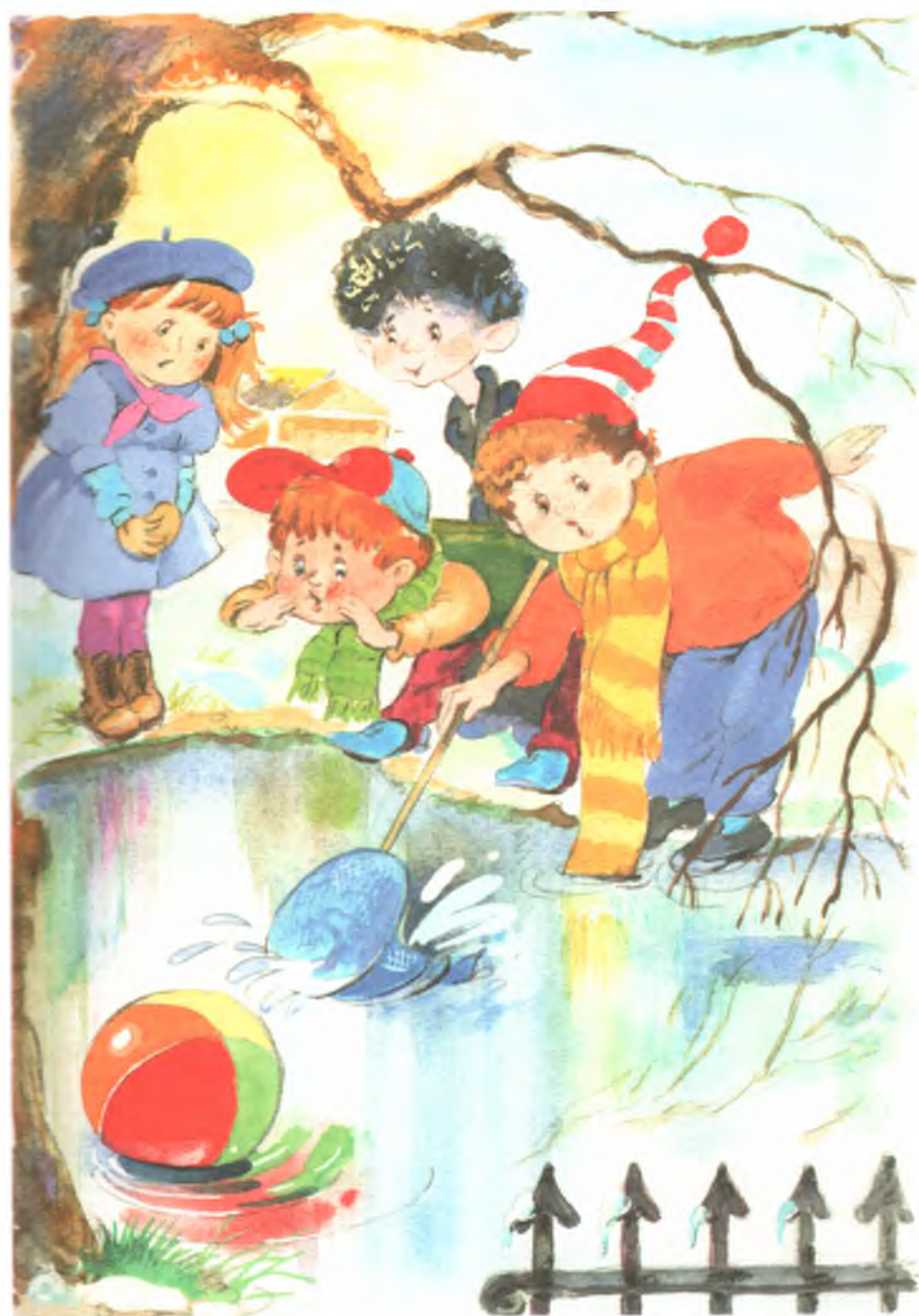
Рис. 3. Мяч