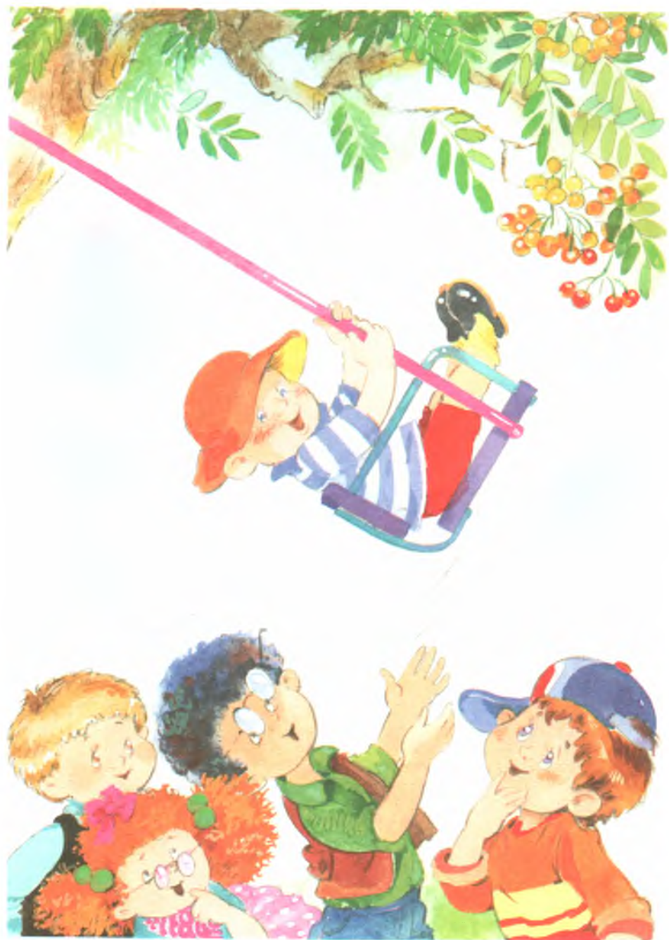
Рис. 6. Качели