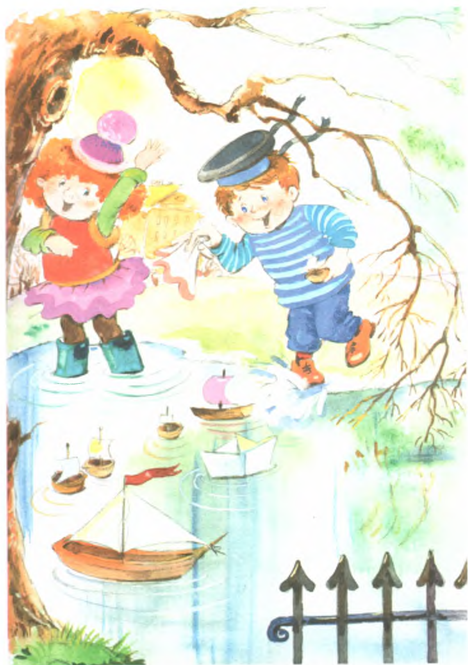
Рис. 1. Лужа