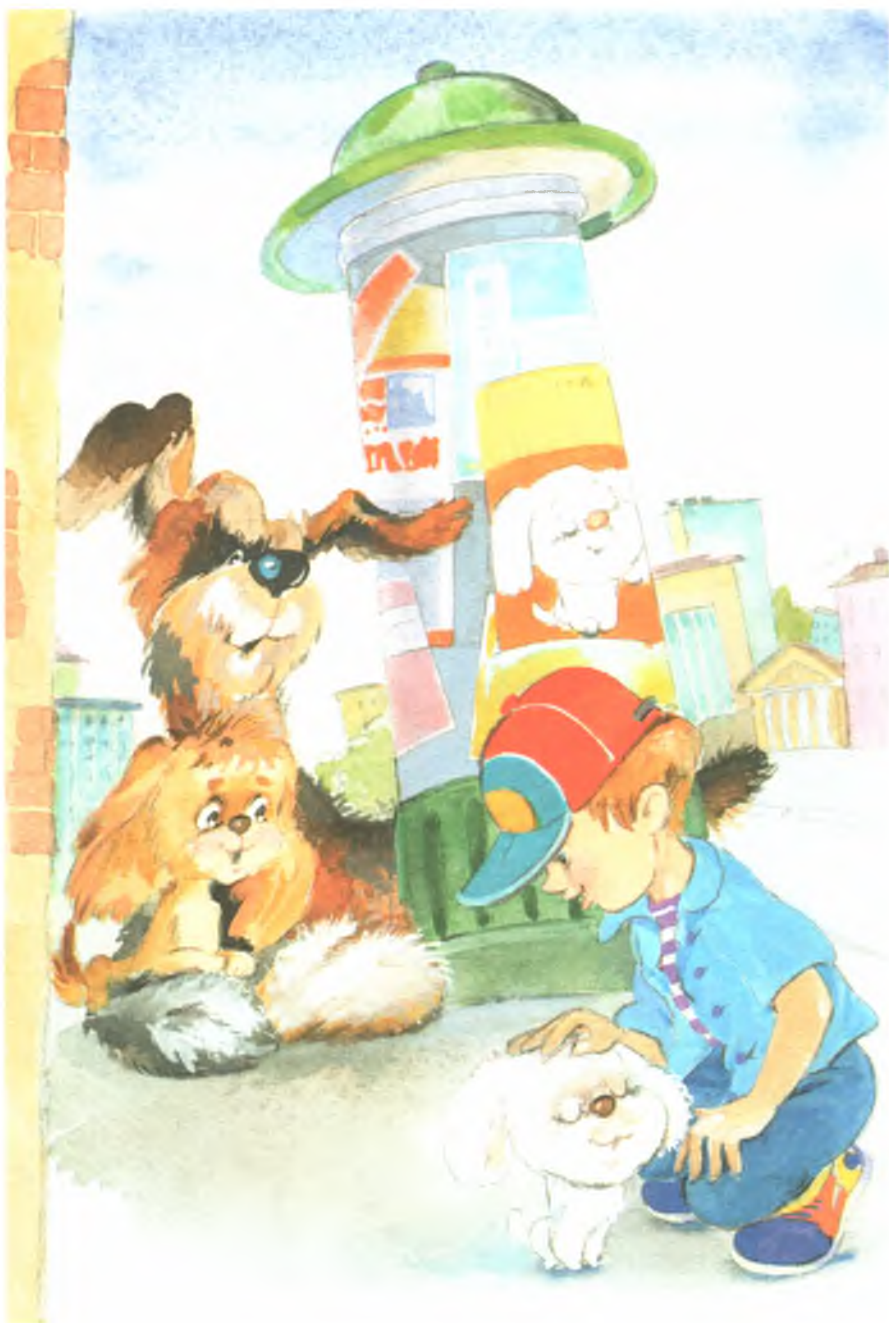
Рис. 4. Афишная тумба