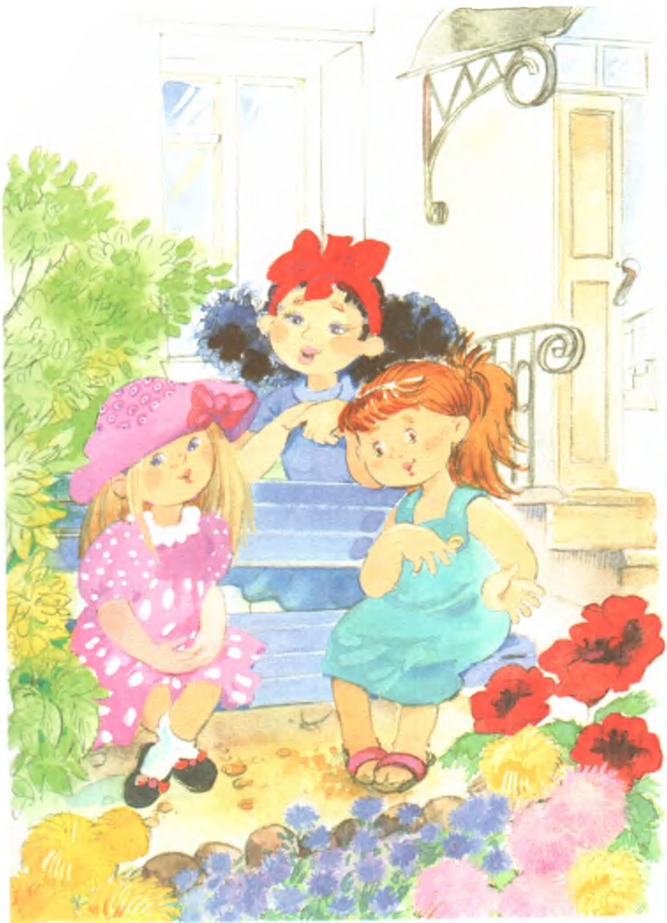
Рис. 7. Клумба