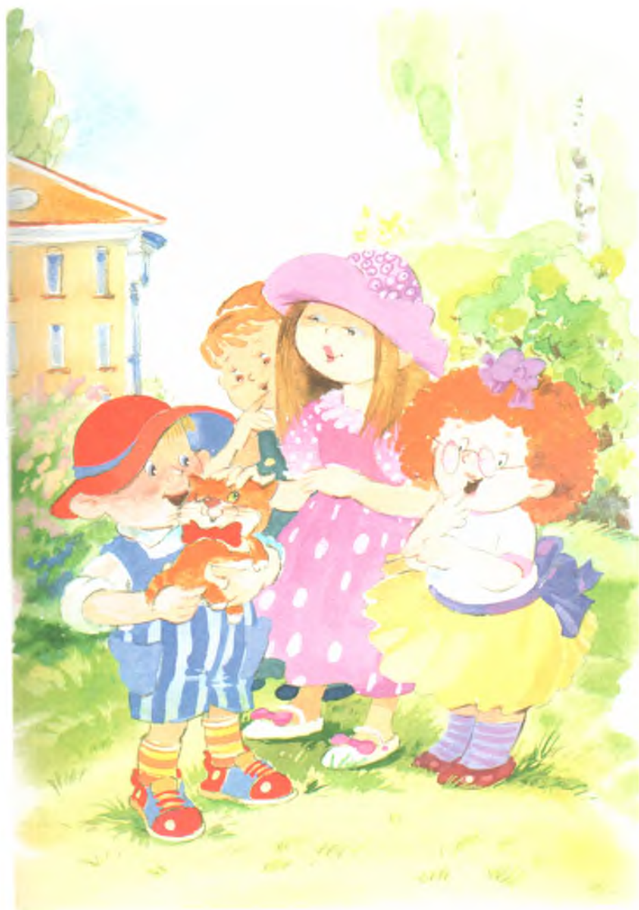
Рис. 5. Прятки