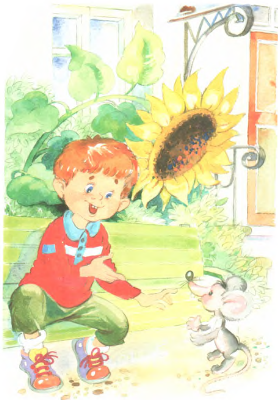
Рис. 8. Мышка