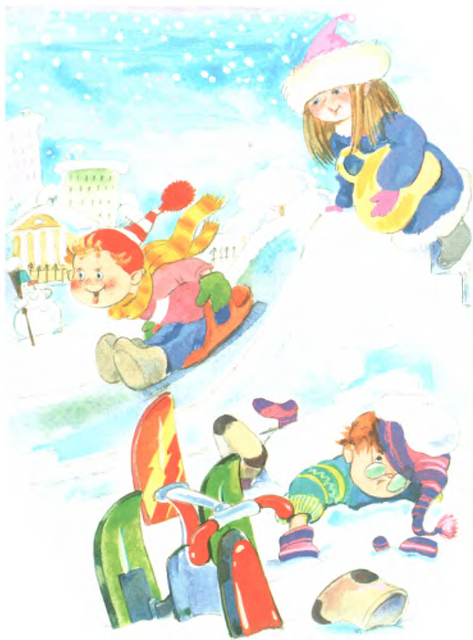
Рис. 13. Горка