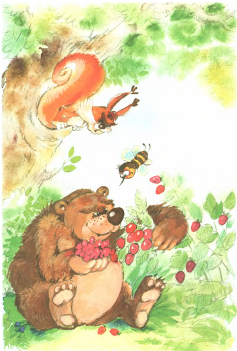
Рис. 16. Как Медведь малиной со всеми делился