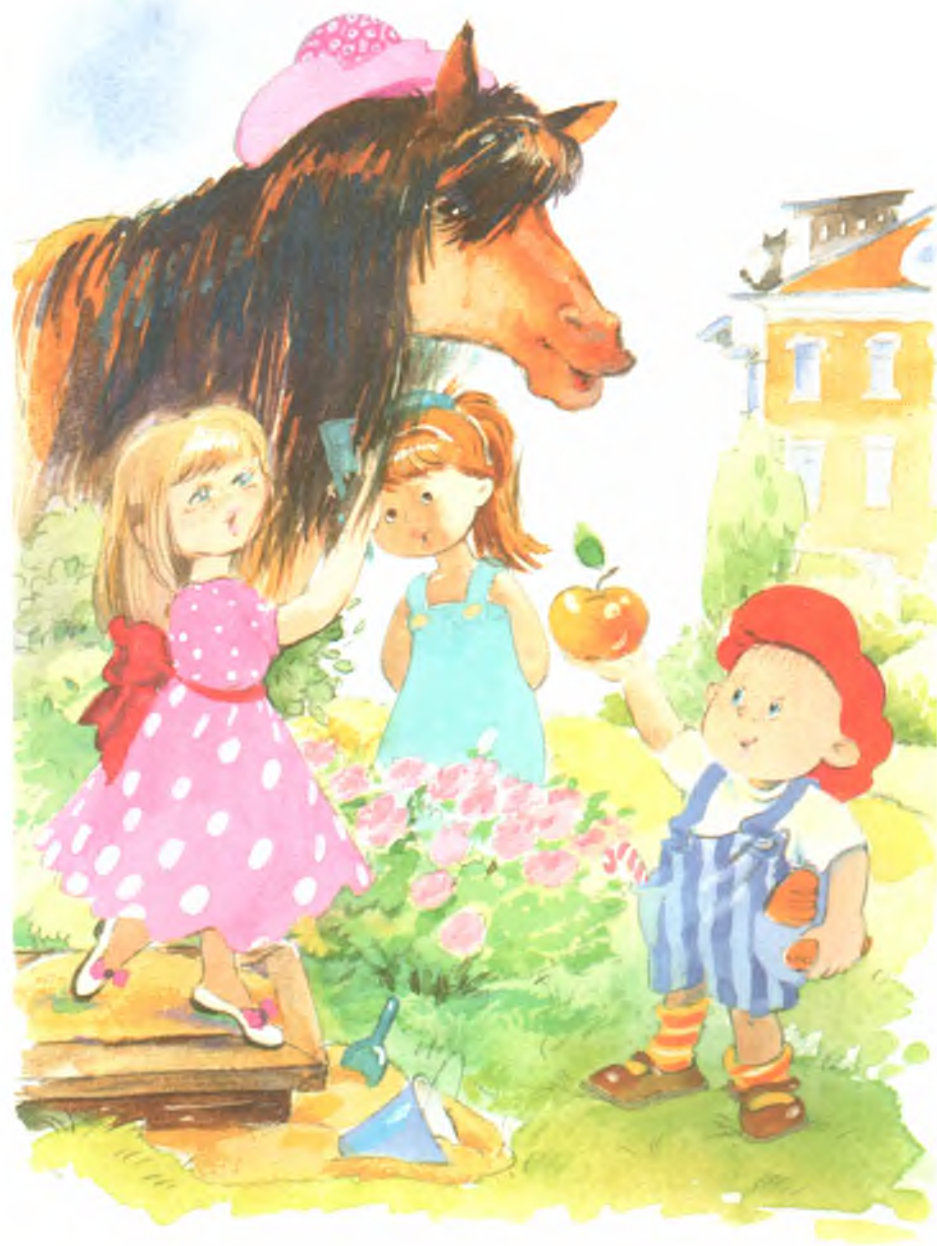
Рис. 10. Газон