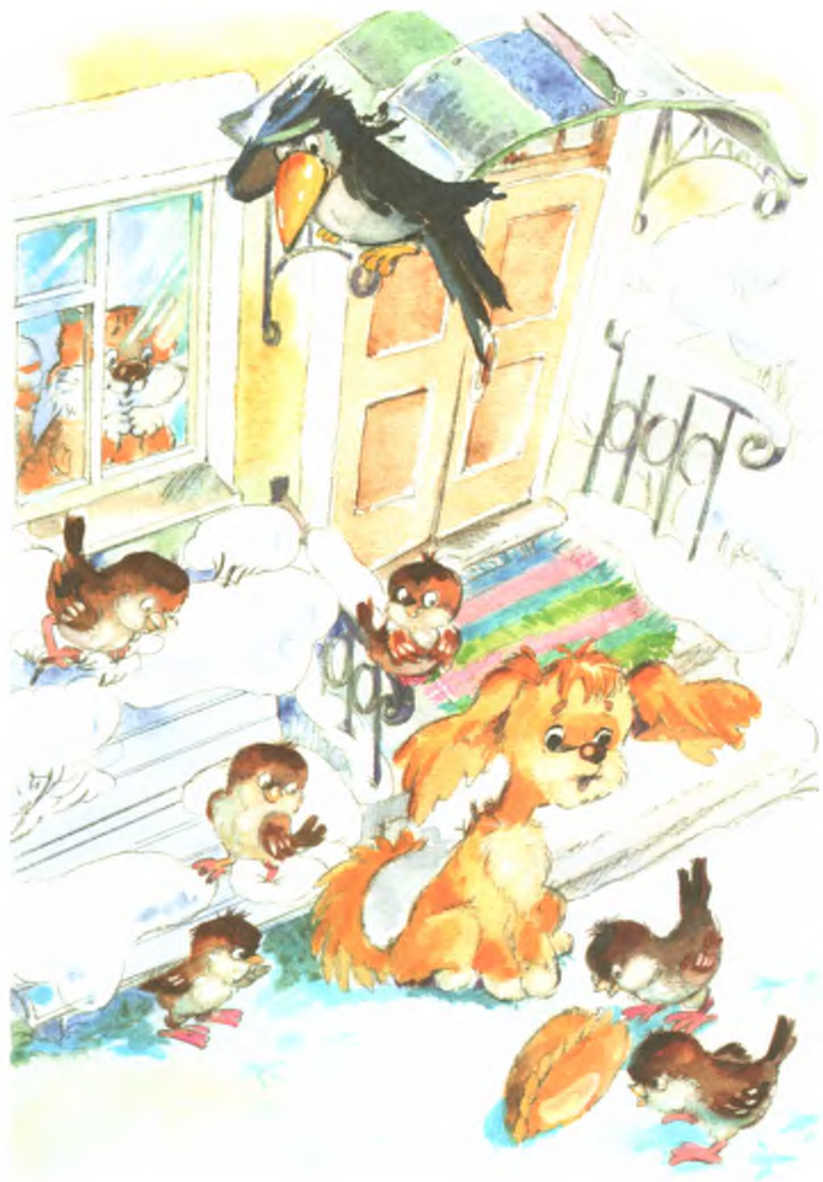
Рис. 14. Пирожок