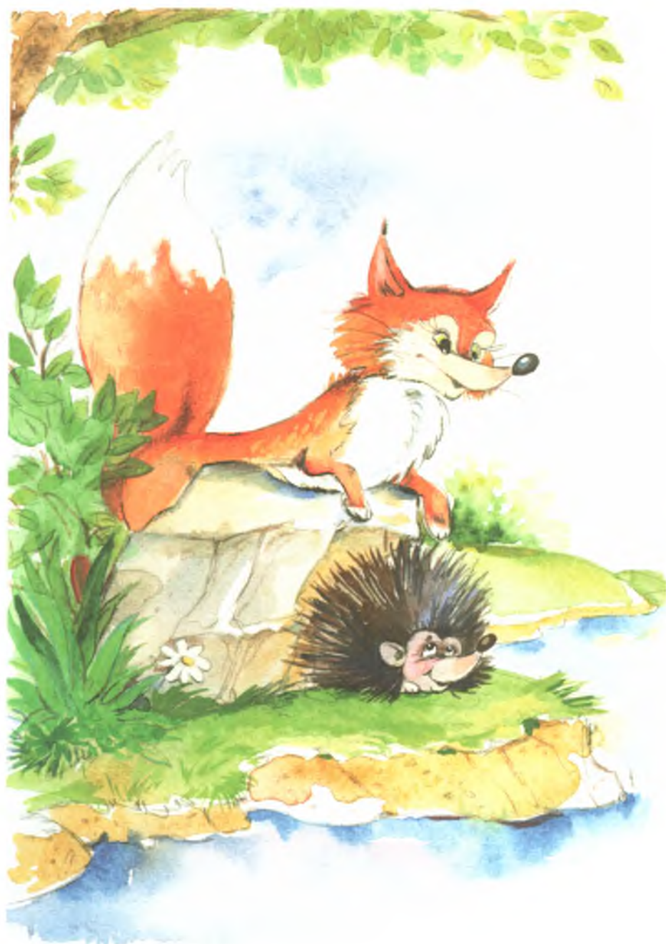
Рис. 15. Как Лиса Ежа перехитрить хотела