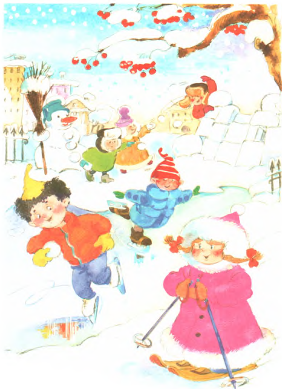
Рис. 11. Снег