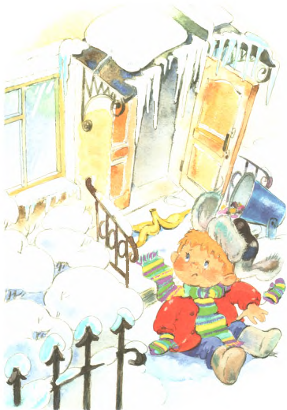
Рис. 2. Дверь