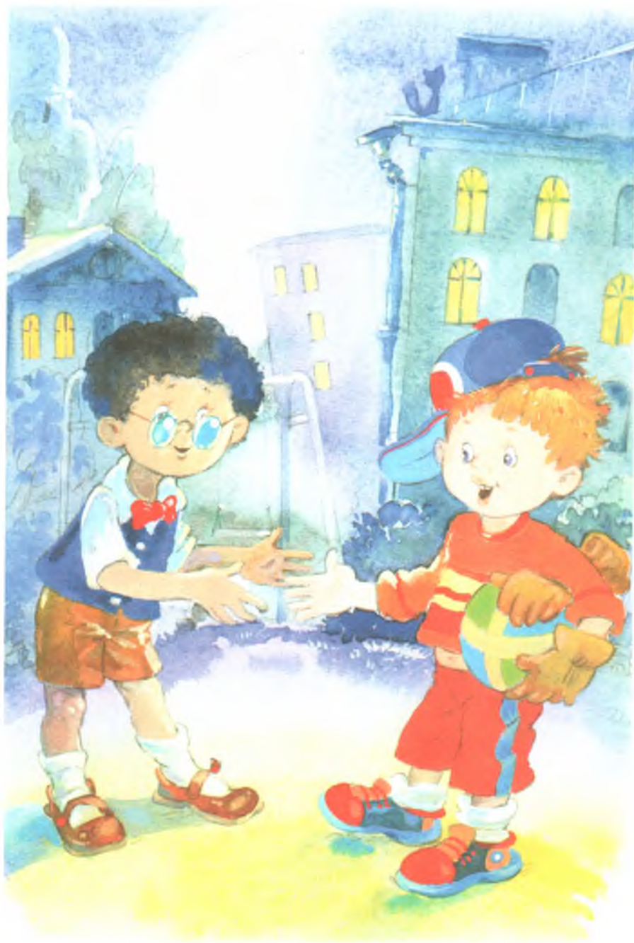
Рис. 9. Окошки