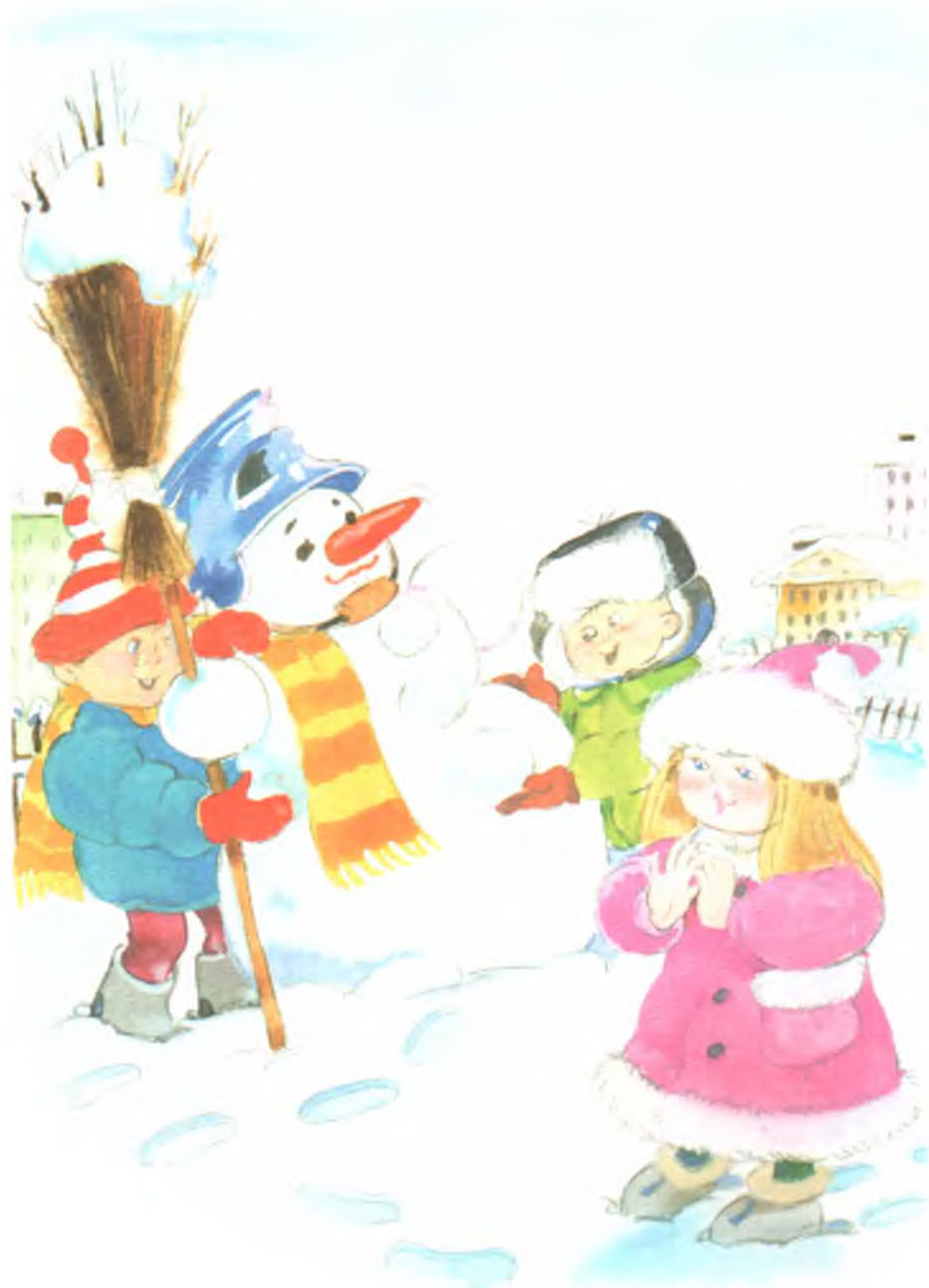
Рис. 12. Снежная Баба